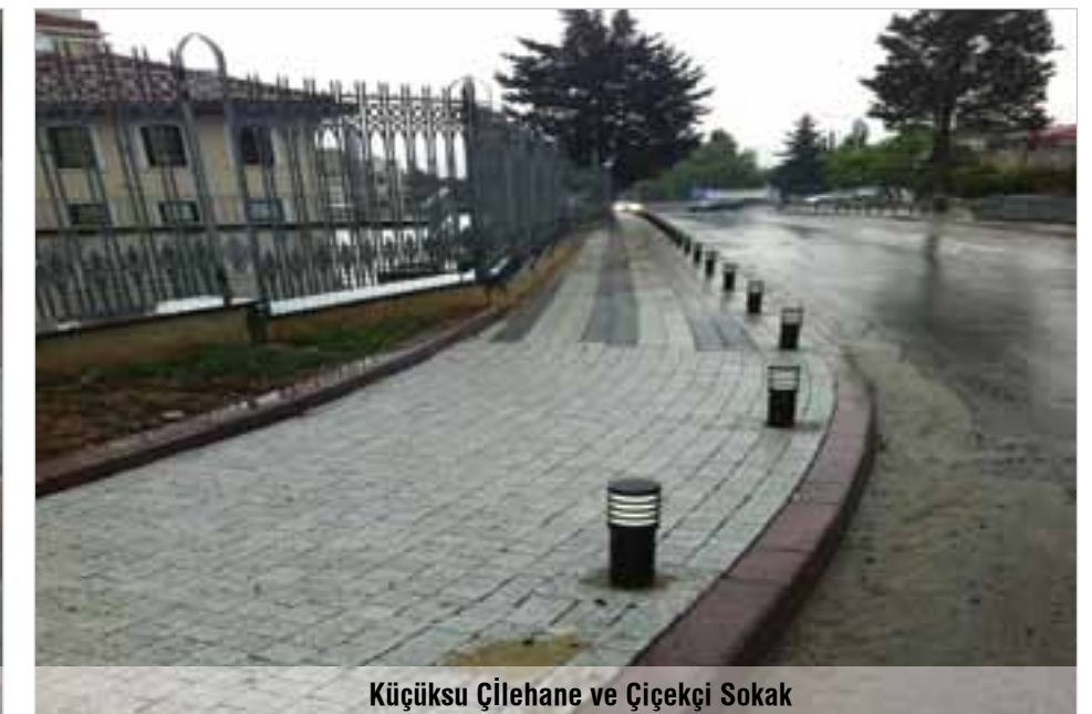
Küçüksu Çilehane ve Çiçekçi Sokak