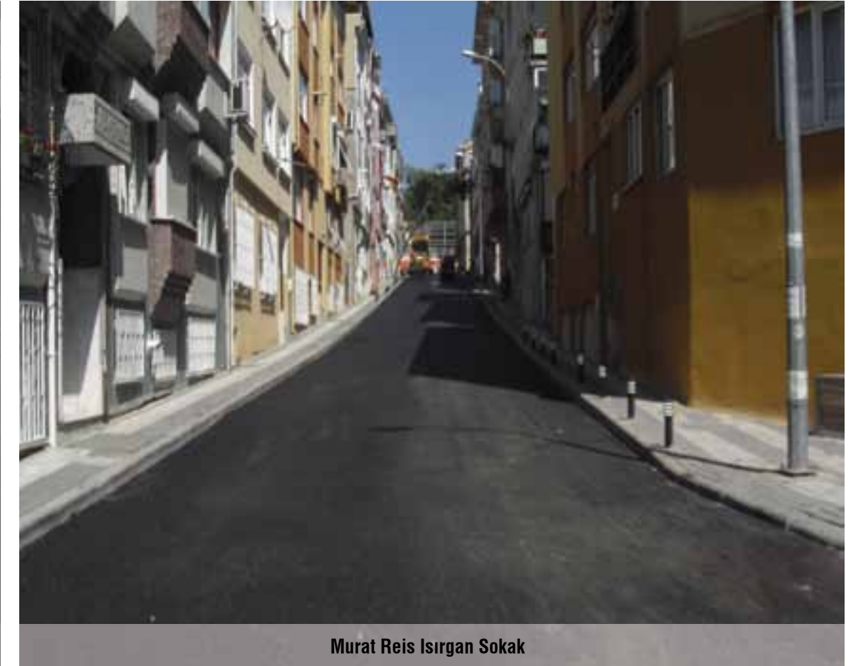
Murat Reis Isırgan Sokak