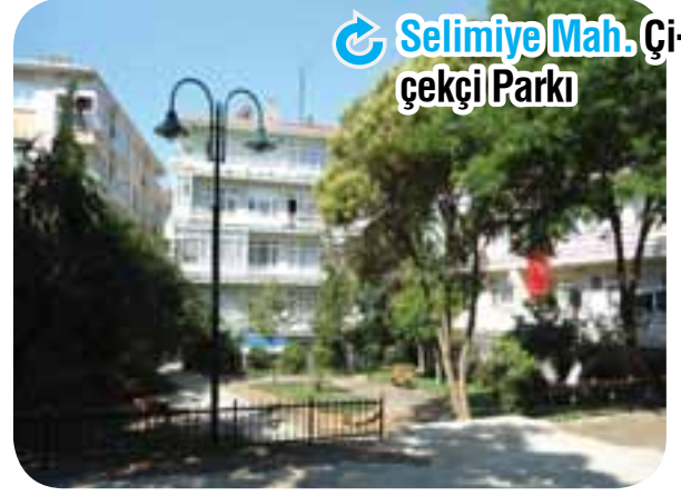
Selimiye Mah. Çiçekçi Parkı