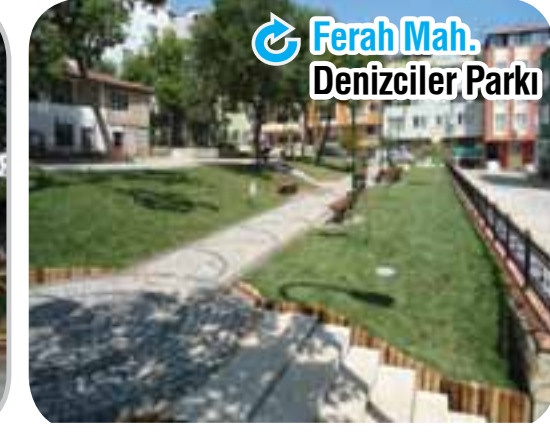
Ferah Mah. Denizciler Parkı