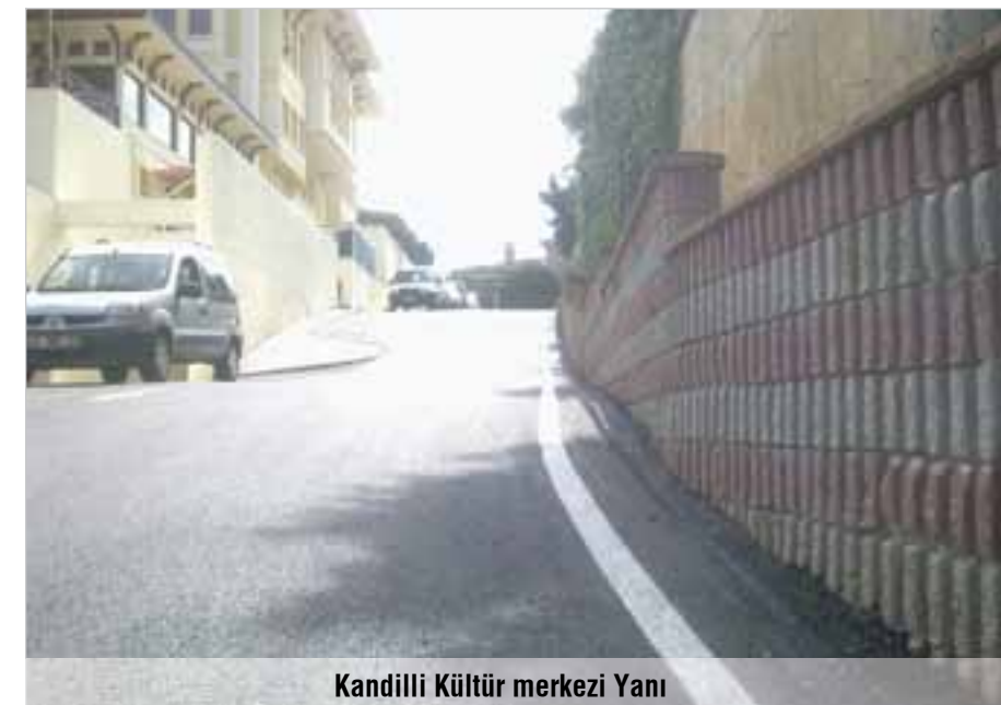
Kandilli Kültür merkezi Yanı