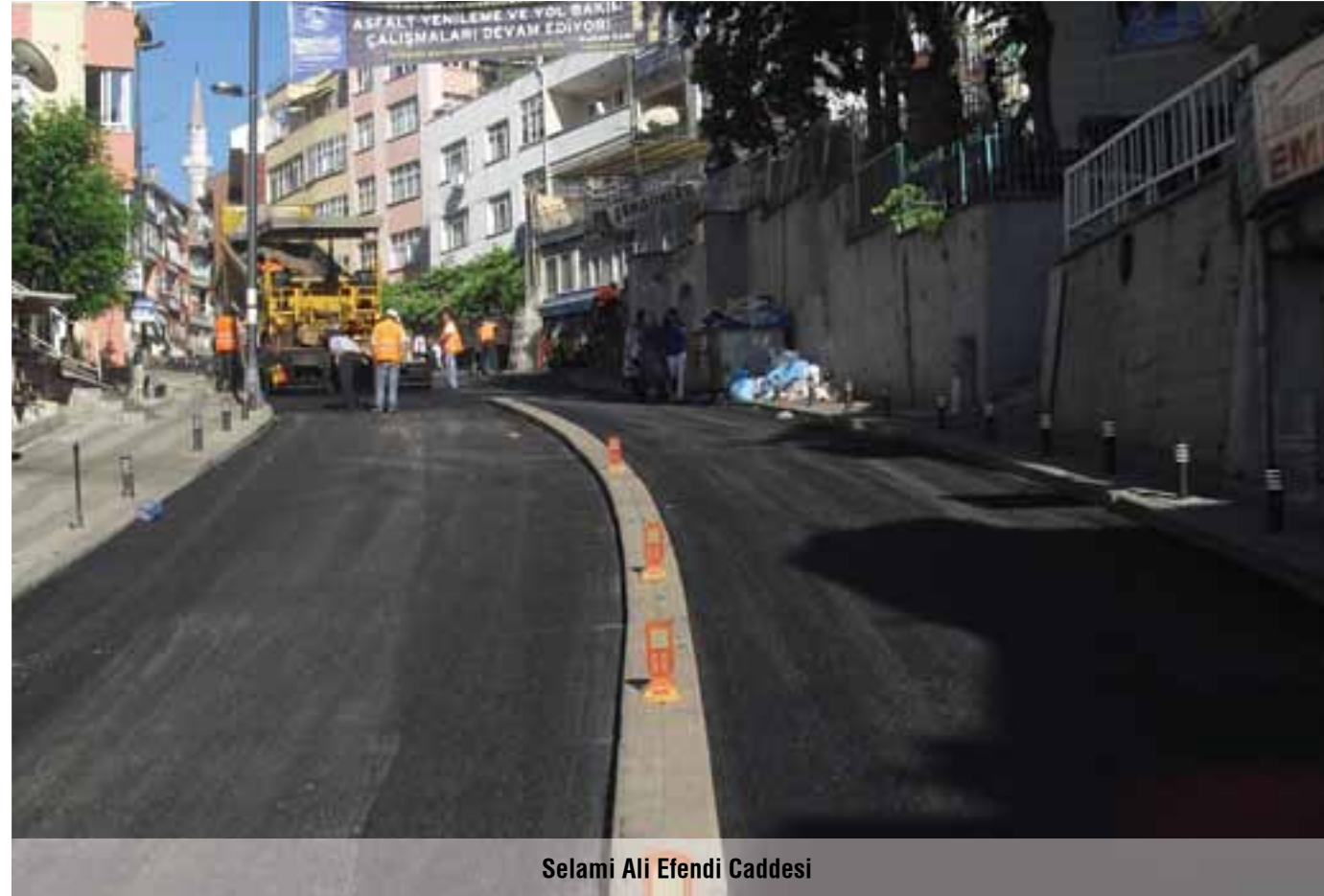
Selami Ali Efendi Caddesi