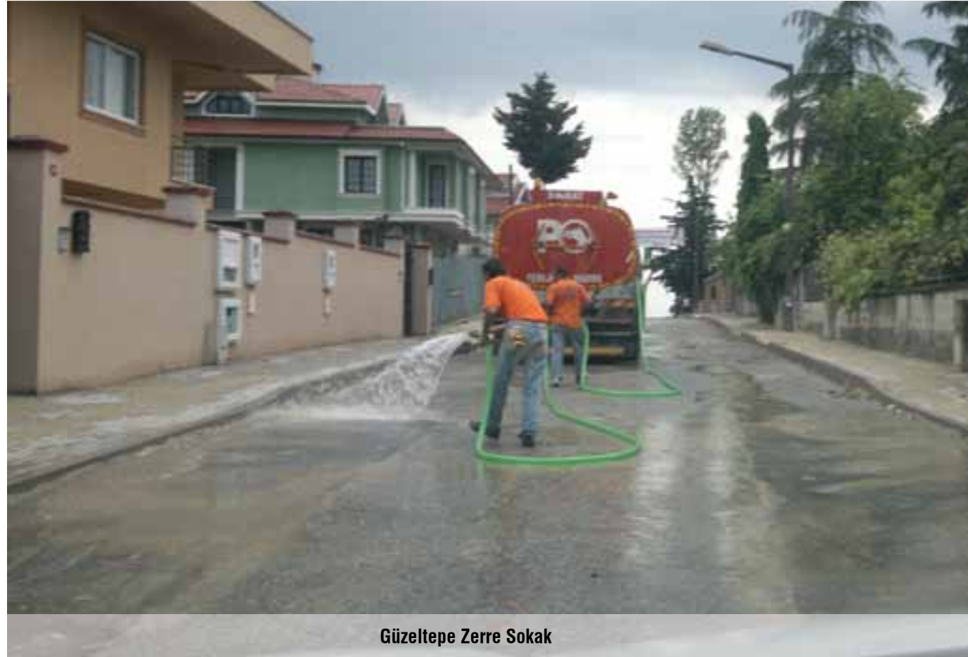
Güzeltepe Zerre Sokak