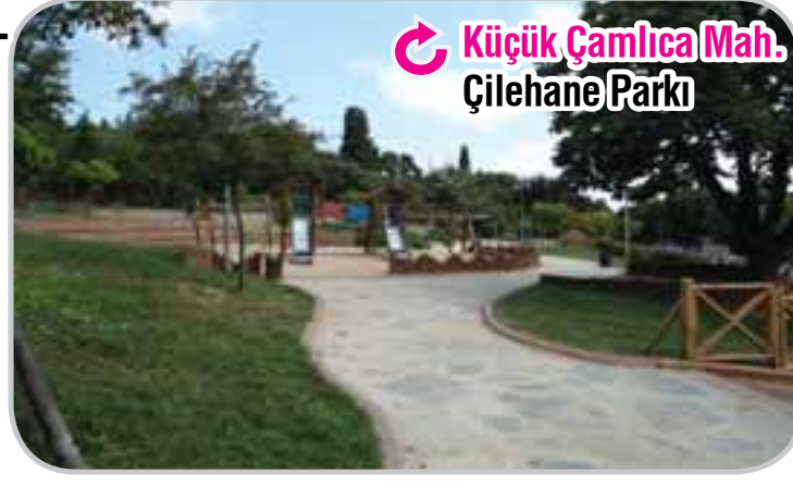
Küçük Çamlıca Mah. Çilehane Parkı