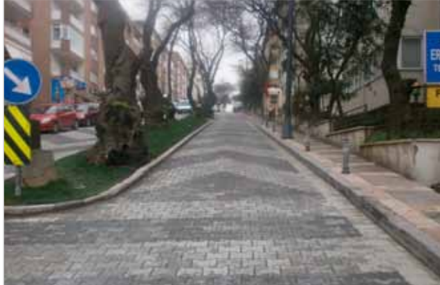
Altunizade Veysipaşa Sokak