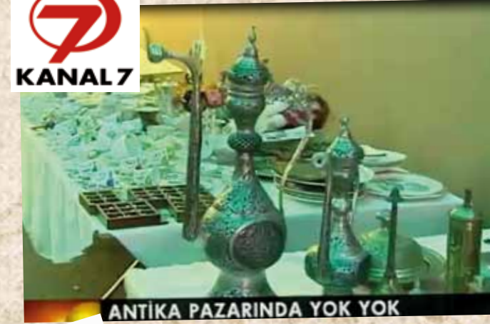
ANTİKA PAZARINDA YOK YOK