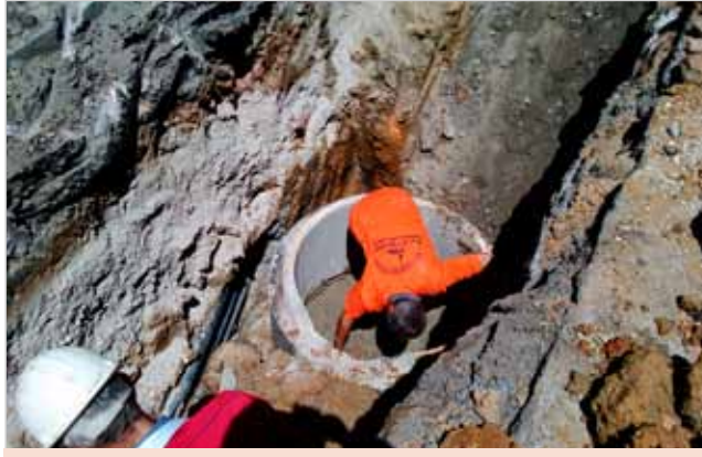
Kısıklı AbdulBaki Gölpınarlı Sk. Altyapı