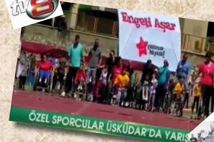
ÖZEL SPORCULAR ÜSKÜDAR'DA YARIŞTI