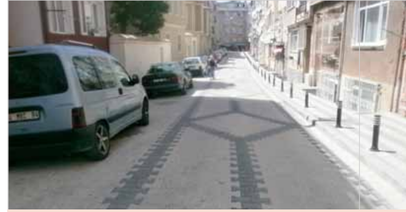
Zeynep Kamil Nalçacı Hasan Sokak