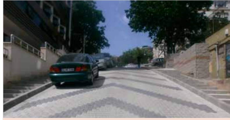
İcadiye Davutoğlu Sokak