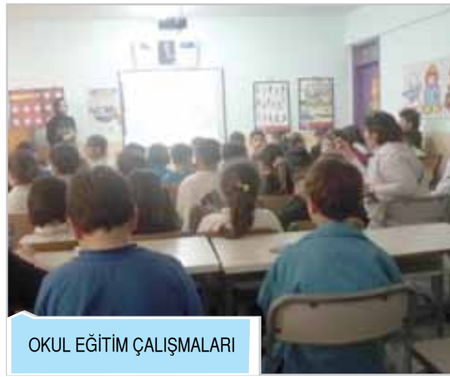
OKUL EĞİTİM ÇALIŞMALARI