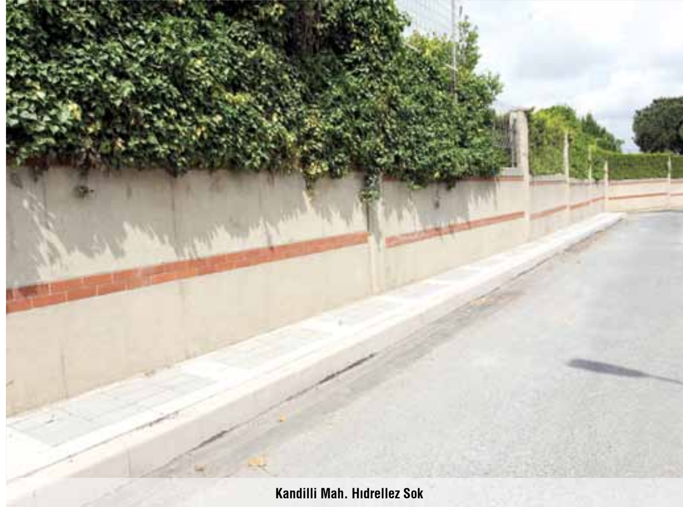
Kandilli Mah. Hidrellez Sok