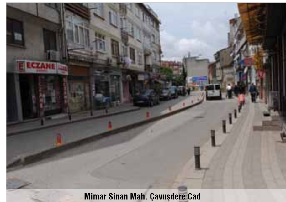
Mimar Sinan Mah. Çavuşdere Cad