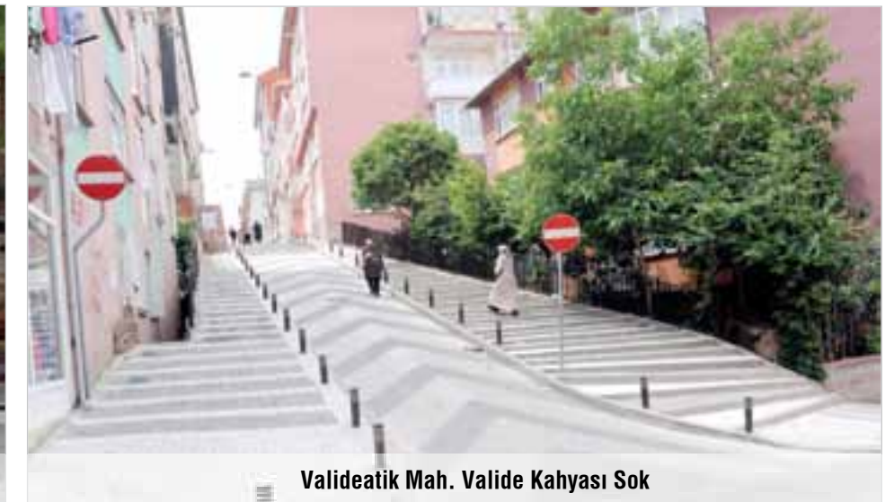
Valideatik Mah. Valide Kahyası Sok