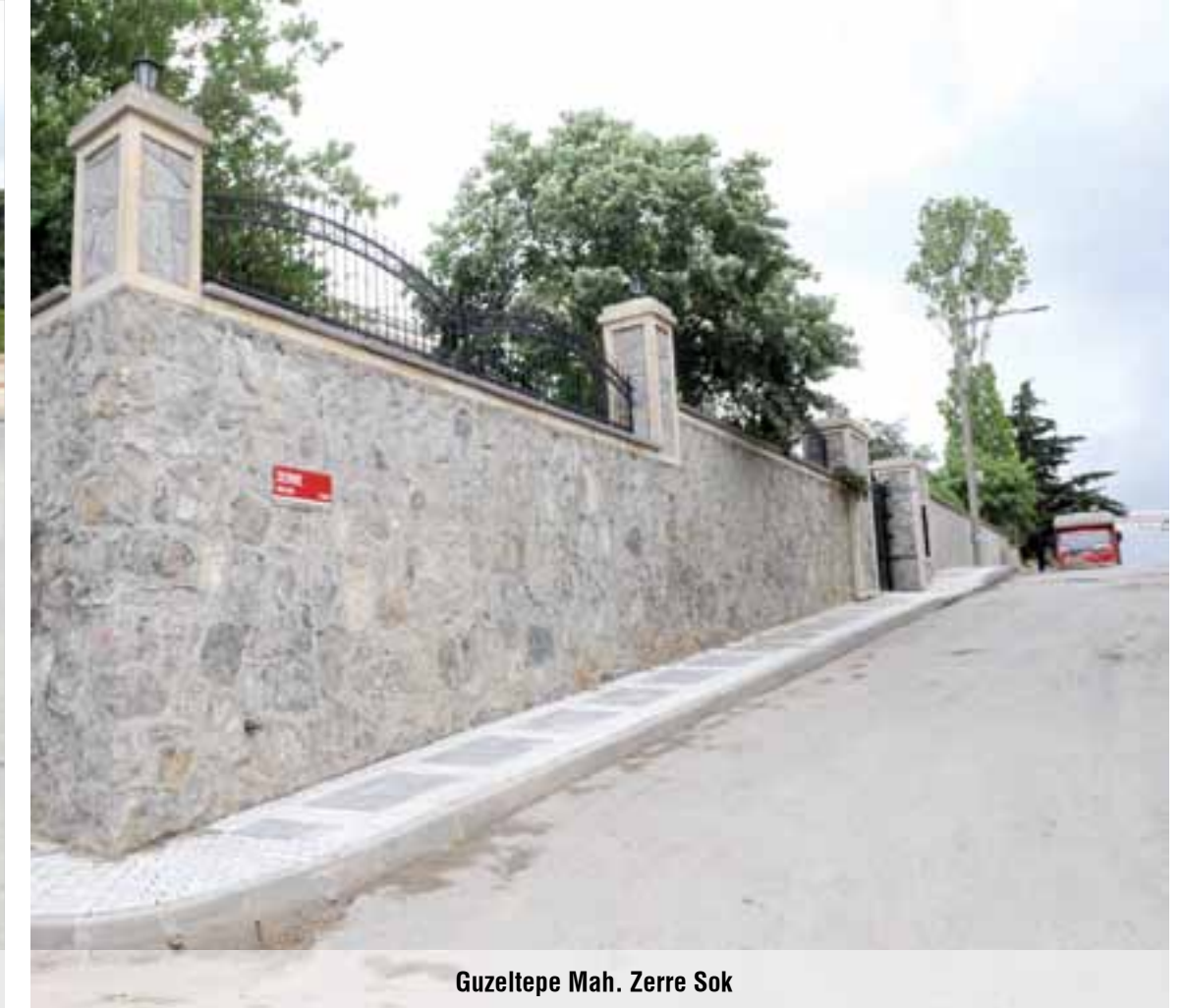
Guzeltepe Mah. Zerre Sok