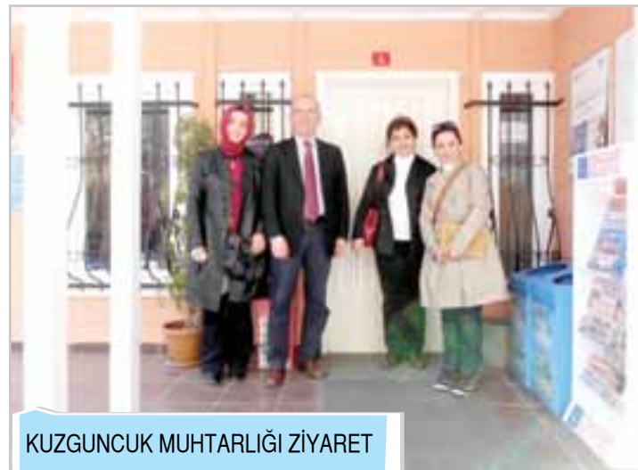
KUZGUNCUK MUHTARLIĞI ZİYARET