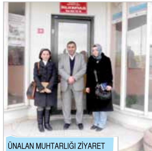
ÜNALAN MUHTARLIĞI ZİYARET