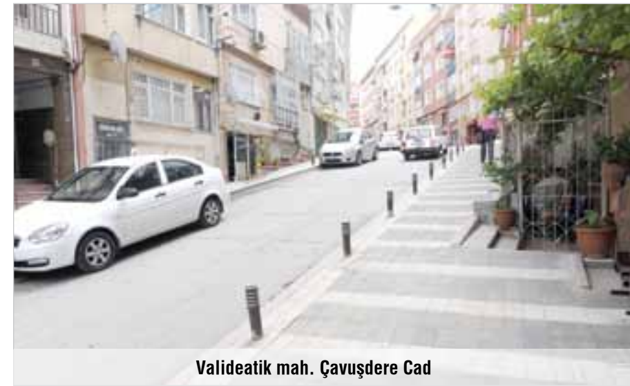
Valideatik mah. Çavuşdere Cad

si için restorasyon çalışmalarına ağırlık verilirken; yeni eserlerin inşa edilmesi adına Kirazlıtepe'de Yaşam Merkezi, Bulgurlu'da semt konağı, Acıbadem'de çocuk kreşi ve Selamiali Mahallesi'nde spor salonu yükseliyor.