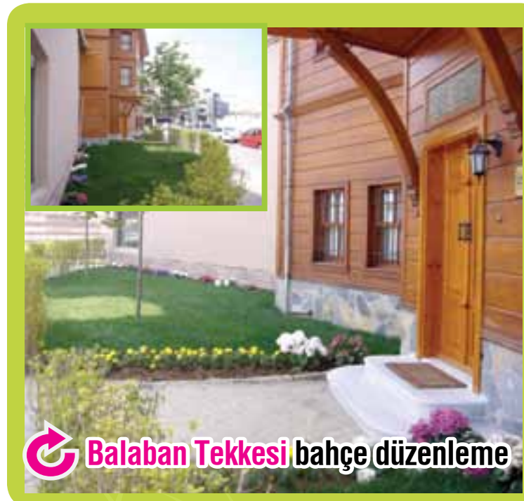
Balaban Tekkesi bahçe düzenleme