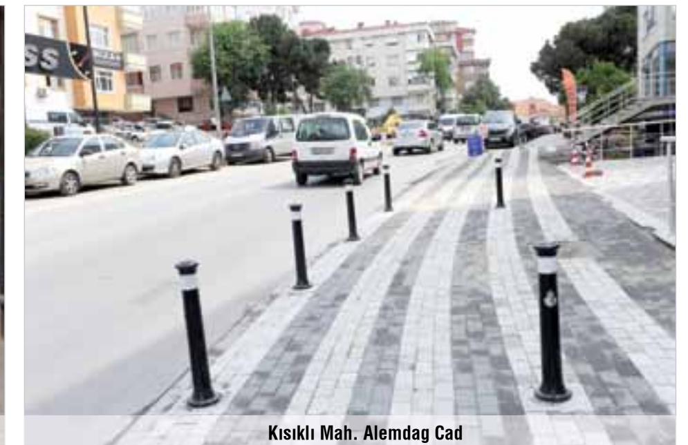
Kısıklı Mah. Alemdag Cad