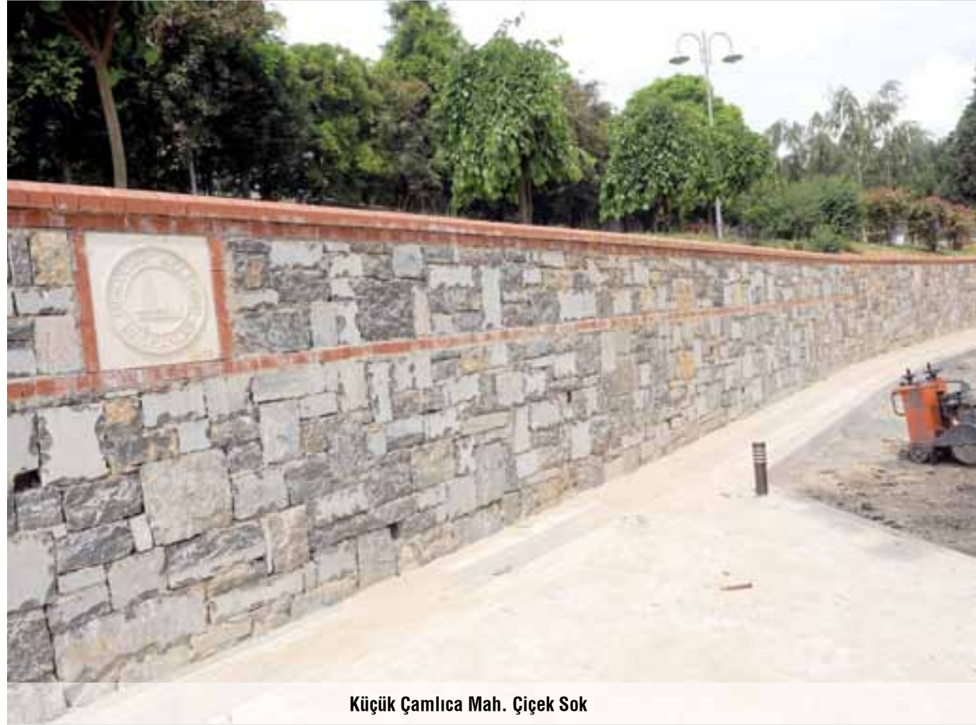
Küçük Çamlıca Mah. Çiçek Sok