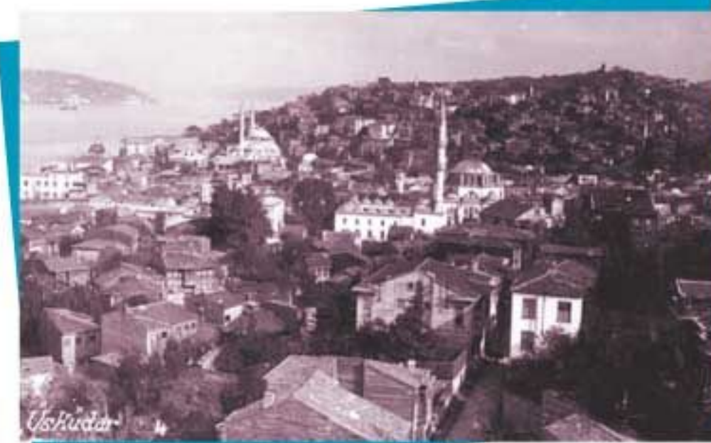
Mihrimah Sultan Camii ve Yeni Camii