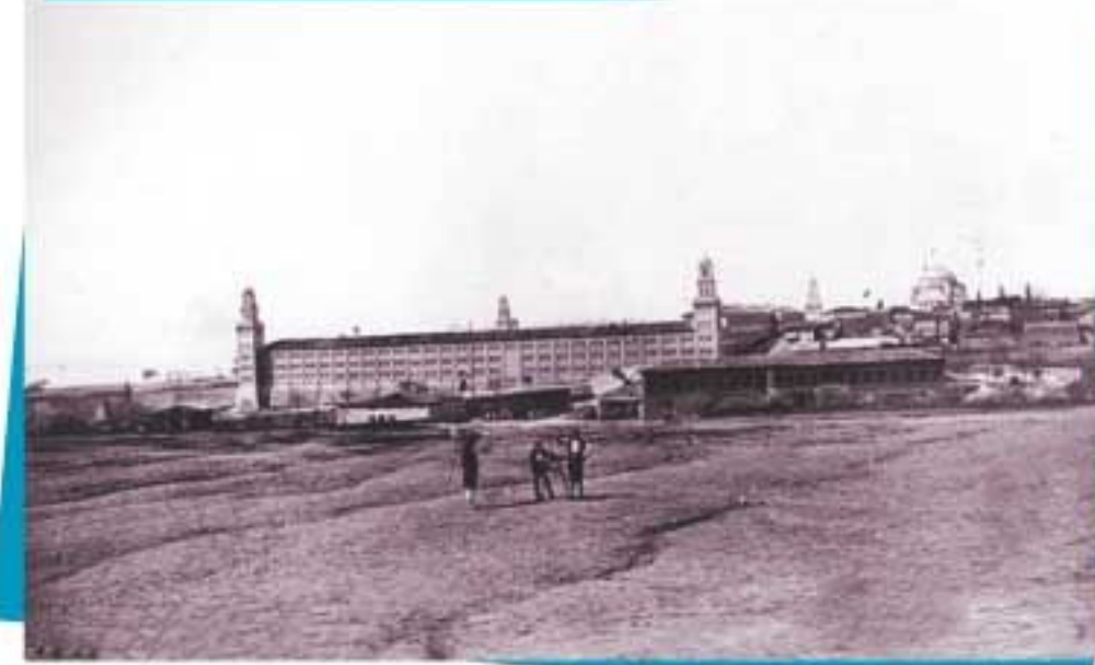
Haydarpaşa Marmara Üniversitesi Kampüsü