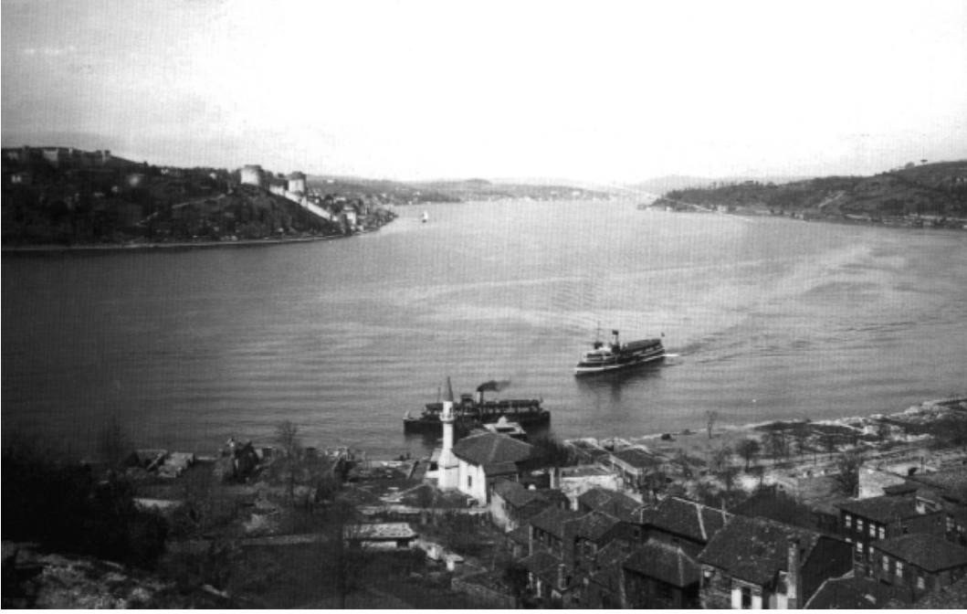
Şirket-i Hayriye Vapuru Boğaz'da yolcu taşırken

şahsına münhasır tarif-i nadidekâr ü belîğinin bihakkın vârislerinden (...)” biçiminde bilge bir kişilik olarak söz etmektedir. 17 Burada karşımıza âdeta tasavvufu mizahla birleştirmiş bir kişilik çıkmaktadır.